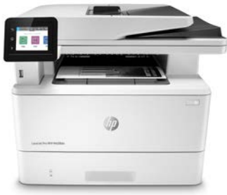
HP LaserJet Pro MFP készülék M428fdn

Ha sikeressé szeretné tenni vállalkozását, okosabb megoldásokra kell támaszkodnia. A HP LaserJet Pro MFP M428 készülékkel a lehető leghatékonyabban használhatja ki az idejét, ami segít az üzlet felvirágoztatásában és abban, hogy megőrizze helyét az élmezőnyben.