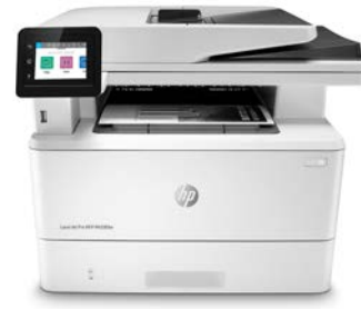
HP LaserJet Pro MFP készülék M428fdw

Dinamikus biztonságot nyújtó nyomtató Kizárólag eredeti HP lapkát használó tintapatronokkal használható. Lehetséges, hogy a nem HP lapkát használó tintapatronok nem működnek, illetve amelyek jelenleg használhatók, a jövőben működésképtelenné válhatnak. További tájékoztatás::